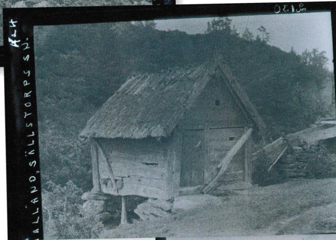
Bilder på tre av kvarnarna tagna av Torsten Lenk 1921, från Göteborgs Stads-museums arkiv (GmHD:2131, GmHD:2130, GmHD:2489).

Som kulturmiljö bär skvaltkvarnarna på flera olika typer av värden, varav det mest framträdande är att de utgör en företeelse som får betraktas som oerhört sällsynt, om inte unik i landet. Det är högst anmärkningsvärt med åtta välbevarade skvaltkvarnar inom ett så avgränsat geografiskt område.